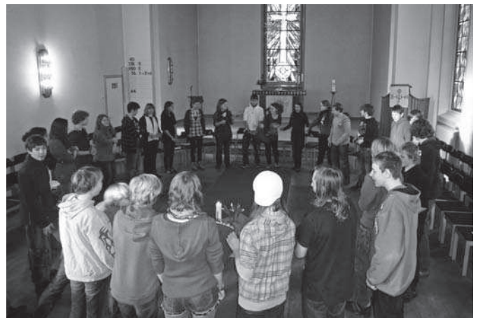
Konfirmandinnen und Konfirmanden zusammen mit Teamern in der Thomas-Kirche

Tja und dann ist das Conferjahr auch schon um. Wir hoffen, dass es den Konfis genauso viel Spaß gemacht hat wie uns. Wir sind als Team richtig zusammengewachsen und haben alle Lust weiterzumachen.