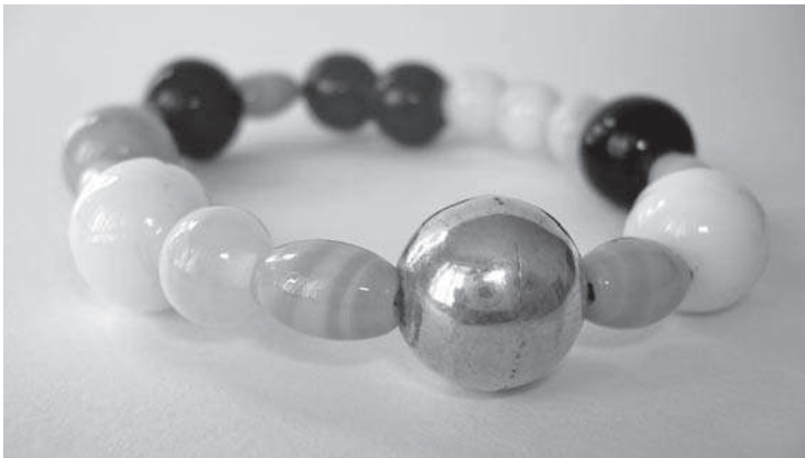
Die Perlen des Glaubens

Als Kennenlernreise sind wir nach Scharbeutz gefahren, zusammen mit den beiden Samstagsgruppen von Frau Schack. Wir waren richtig viele Leute, über 100 und haben uns mit den Perlen des Glaubens beschäftigt. Das war klasse, weil jede Perle für ein Glaubenthema steht, das uns im späteren Konfer wieder begegnet ist.