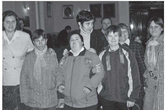
Wohngruppe „Casa Sperantei“