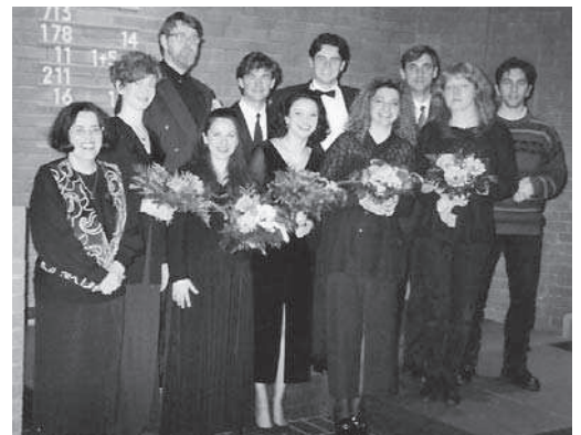
Nach einem Konzert 1997 in der Matthias-Claudius-Kirche