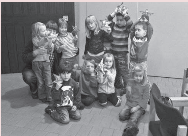
Kinder in der Thomas-Kirche

Pastorin Fohl wartete schon mit Krippenfiguren und einer wunderschönen Krippe auf die Kinder. Die Kirche erstrahlte im Kerzenschein. Anlässlich der Weihnachtszeit erzählte Pastorin Fohl die Weihnachtsgeschichte. Die Kinder konnten währenddessen die Krippenfiguren passend zur Geschichte anordnen. Durch diese Art die Geschichte zu erfahren, lernten die Kinder, dass Kirche lebendig ist. Fröhliches Lachen, Gesang und Fußgetripel von den Kindern erfüllte die Thomas-Kirche.