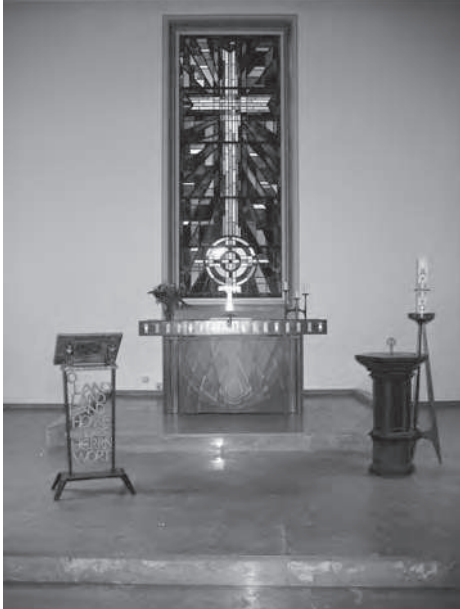
Innenraum der Thomas-Kirche

Im November begeht die Kirchengemeinde Meiendorf-Oldenfelde das 75-jährige Jubiläum der Weihe ihrer Thomas-Kirche an der Meiendorfer Straße. Für viele Jahre war die Thomas-Kirche die einzige Kirche in Meiendorf und Oldenfelde.