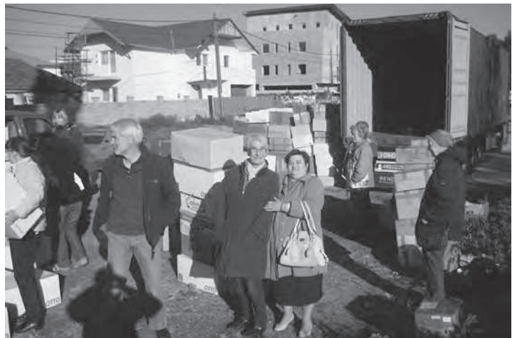
Beim Abladen in Temeswar

TEMAH – Temeswar-Arbeitsgemeinschaft Hamburg