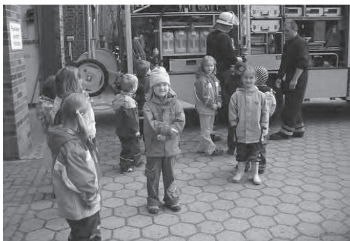
KiTa-Kinder bei der Feuerwehr

Den Erzieherinnen und dem Kindergarten stellen sich zwei Herausforderungen: Die Kindergärten sind heute verstärkt eine Bildungseinrichtung, die spielerisch Wissen in allen Bereichen vermittelt und auf die Schule vorbereitet.