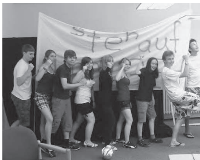
Szenenfoto aus dem Stück „steh auf und geh“

Vom 2.-4.Juli fand in Hamburg das zweite nordelbische Heaven-Festival in Travemünde statt. Bei strahlendstem Sommerwetter erlebten 18 Meiendorf-Oldenfelder Jugendliche ein buntes Festival-Programm zwischen Ostseestrand und Brüggmann-Garten. Da gab es Live-Musik, workshops, eine tolle Spielemeile, Jugendgottesdienste, Andachten direkt am Meer und ein unvergessliches Fußballspiel Deutschland-Argentinien (4:0), das wir in einem ehemaligen Schwimmbad (ohne Wasser) „public viewten“. Das war nun mehr, als uns zum Glück fehlte.