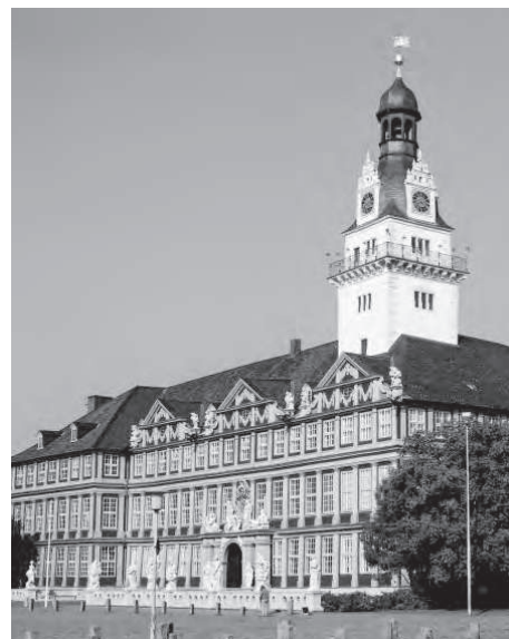
Residenz Schloss in Wolfenbüttel

Unsere Herbstfahrt mit dem Gesprächskreis für Glaubensfragen führt diesmal zu interessanten Bauwerken und Kunstschätzen in Wolfenbüttel und nach Braunschweig. Wir besichtigen das Wolfenbütteler Schloss und die Herzog-August-Bibliothek und unternehmen einen Stadtrundgang. In Braunschweig lernen wir mit Führungen den Dom, die Burg Dank-