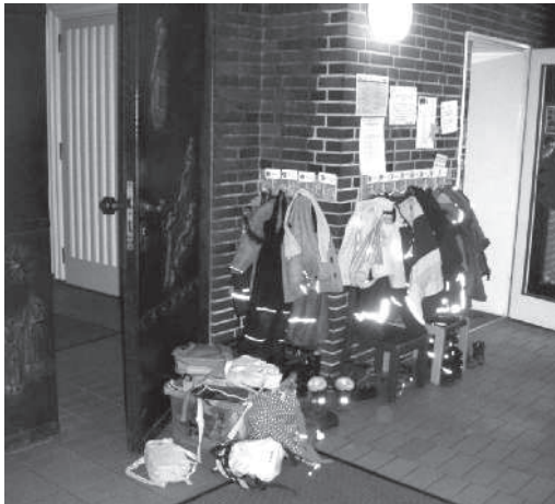
Kindergarderobe an der Thomas-Kirchentür

Während der letzten Monate hatten es vor allem die Erwachsenen nicht leicht: Längere Wege und eine hohe Lärmbelastung in den Räumen für die Erzieherinnen sorgten für anstrengende Tage im Gemeindezentrum. Ein Großeinkauf bei IKEA sorgte für Teppiche und andere Utensilien, um die Räumlichkeiten behaglicher zu machen.